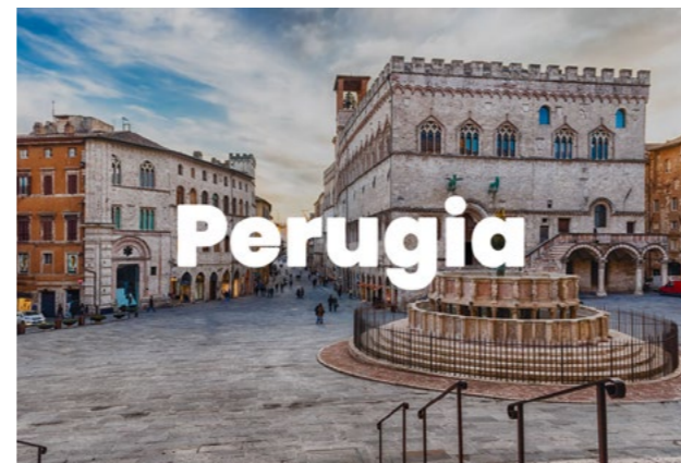
Perugia - sede di riferimento Via Soriano, 12 - 06132 Perugia (PG)