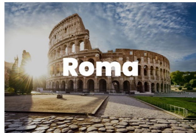
Roma - sede di riferimento Via Cristoforo Colombo, 440 - 00145 Roma (RM)