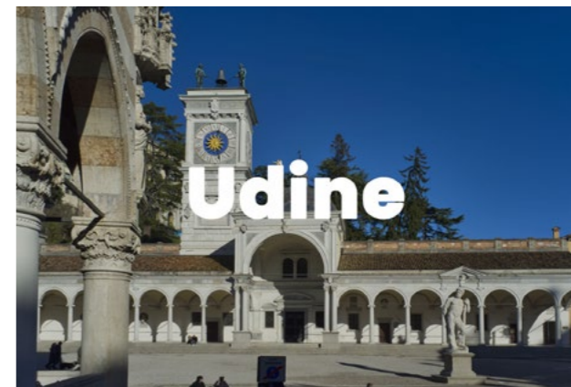
Friuli - sede di riferimento Via Mantova, 108/E - 33100 Udine (UD)