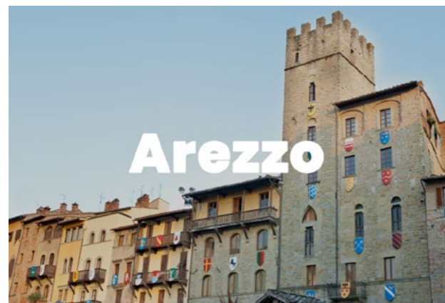
Arezzo - sede di riferimento Via Romana n. 64 - 52100 Arezzo (AR)