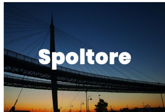
Spoltore - sede di riferimento Strada Statale 16bis, 86 - 65010 Spoltore (PE)