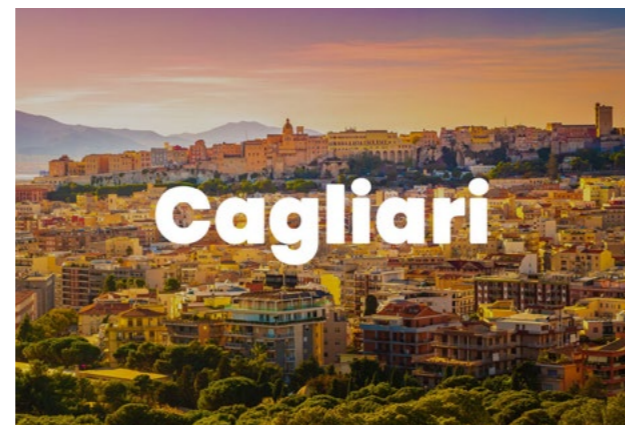
Cagliari - sede di riferimento Via Garigliano, 11 - 09123 Cagliari (CA)