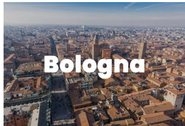
Bologna - sede principale Via dell' Arcoveggio,70 - 40129 Bologna