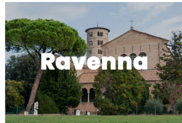
Ravenna - sede di riferimento Via Filippo Re, 18 - 48124 Ravenna (RA)