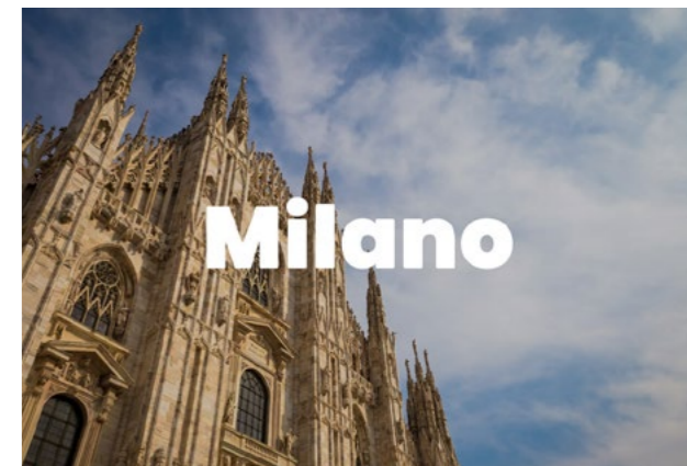
Milano - sede di riferimento Via Cristoforo Colombo, 12 - 20094 Corsico (MI)